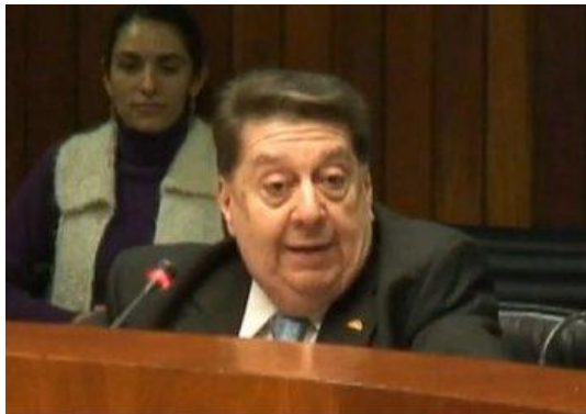
José Félix Fernández Estigarribia, canciller nacional.

El canciller José Félix Fernández Estigarribia, explicó que Paraguay planteó ante el Tribunal del MERCOSUR, la nulidad de los actos de Argentina, Brasil y Uruguay y que éstos países contestaron impugnando el procedimiento. Además, alegaron que el organismo no tiene competencia para entender en el caso.