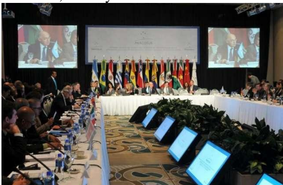
Cancilleres en reunión de Mercosur celebrada en Mendoza, Argentina

El equipo jurídico del Gobierno paraguayo realizó el trámite ante el Tribunal Permanente, con sede en Asunción, como ya lo había anunciado la semana pasada el canciller José Félix Fernández Estigarribia