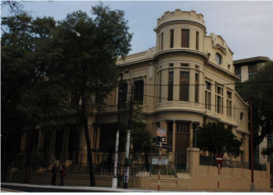
La sede del Tribunal Permanente del Mercosur está en Asunción.