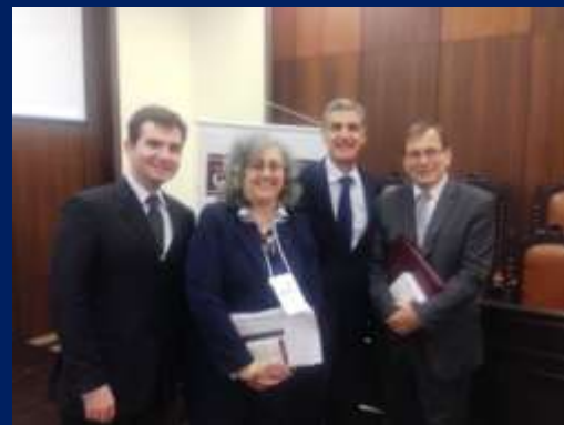
-Participación del TPR en las Jornadas ASADIP 2014, realizadas en la ciudad de Porto Alegre, entre los días 30 de octubre y 01 de noviembre